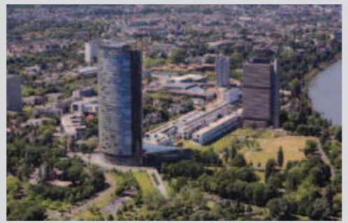
Post Tower und UN Campus

Niederrheinisch-Westfälische Gesellschaft für Gynäkologie und Geburtshilfe